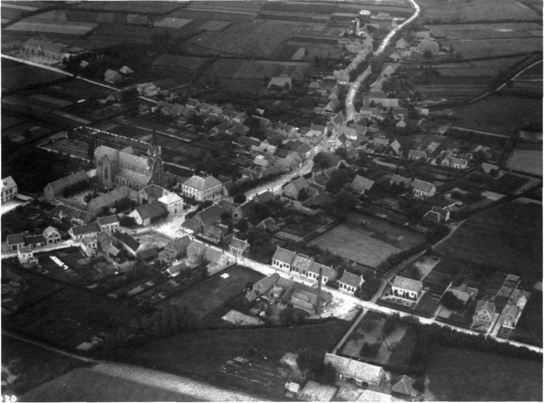
Figuur 3. De Beek in 1926, gezien vanuit het zuiden